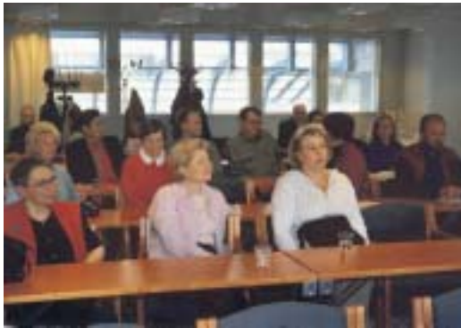
Osa talvipäivien osallistujia ravintoterapeutin luennolla.