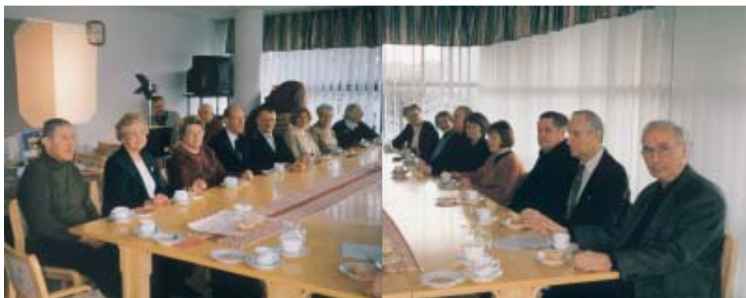
Päiväkerholaisia Ruusukorttelissa Turussa helmikuussa 2003.